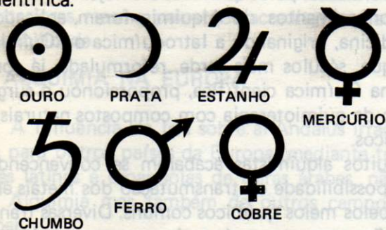
Os sete metais conhecidos desde a Antiguidade, com os símbolos usados na Idade Média.

Finalmente, pode-se afirmar, de acordo com muitos historiadores da Ciência, que a junção do raciocínio grego, com a técnica e a erudição árabes, somados à comprovação experimental dos fatos pelos europeus, deu origem à Química científica.