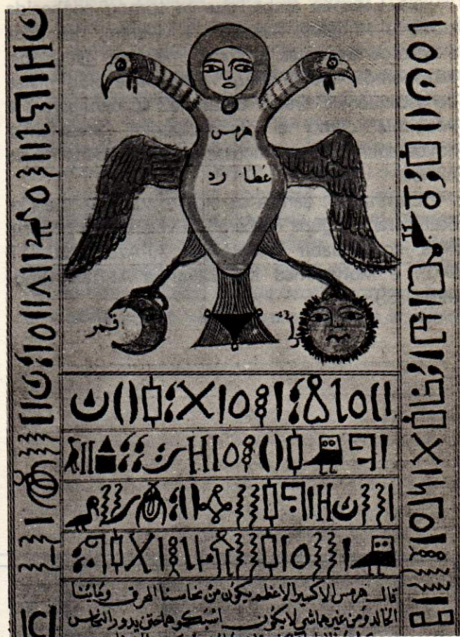
Representação do lendário Hermes de Trimegisto, fundador da Alquimia Egípcia. O quadro resume os princípios das transformações químicas: o Sol é o pai e a Lua, a mãe, sendo a Terra, a nutriz.

A antiga tradição egípcia atribuía a origem de todos os conhecimentos, inclusive os conhecimentos práticos que deram origem à Alquimia, ao deus Thoth. Os autores de Alexandria atribuía as origens da arte da chemeia ou chimia a um lendário personagem, Hermes Trimegisto, reverenciado como a fonte de toda sabedoria. O nome Hermes deu origem às expressões "hermético" e "hermeticamente fechado", pois, na época, eram correntes referências a assuntos nebulosos, cheios de mistérios, fechados e secretos, dos quais "Hermes mantinha o segredo".